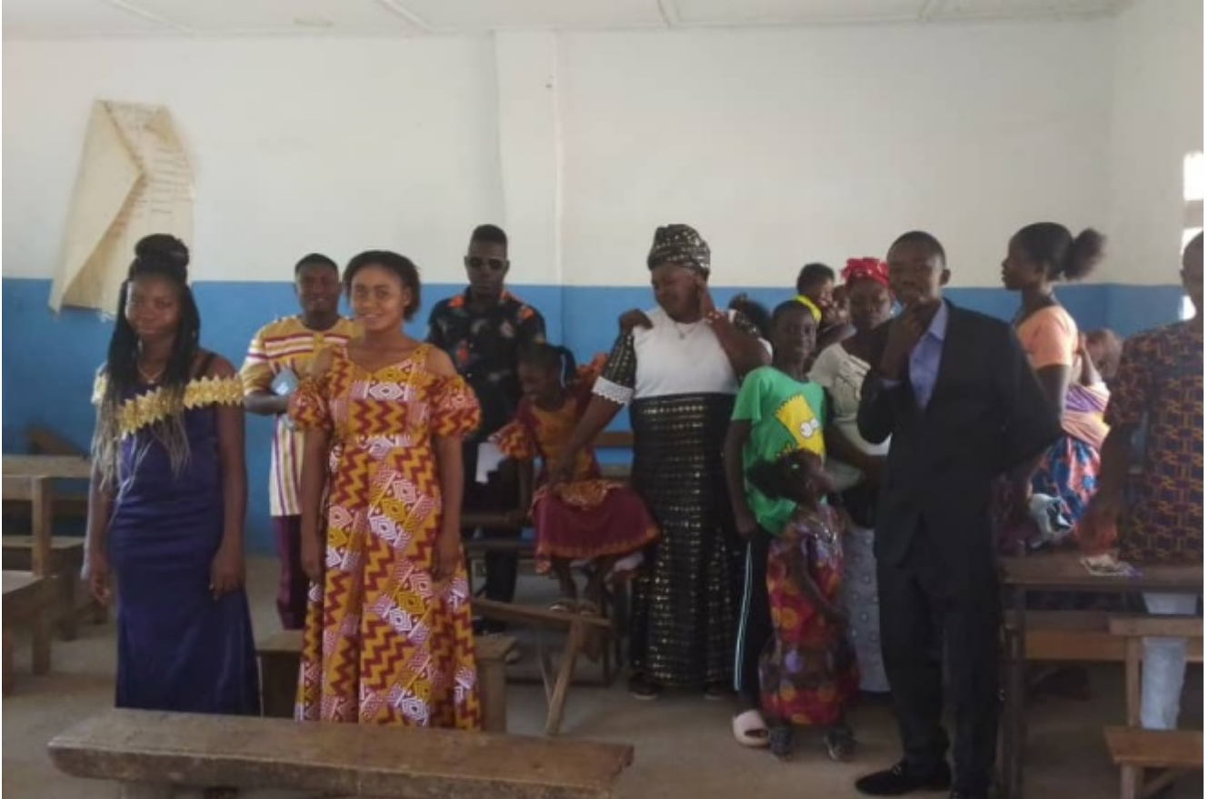
Gemeindemitglieder aus Sierra Leone