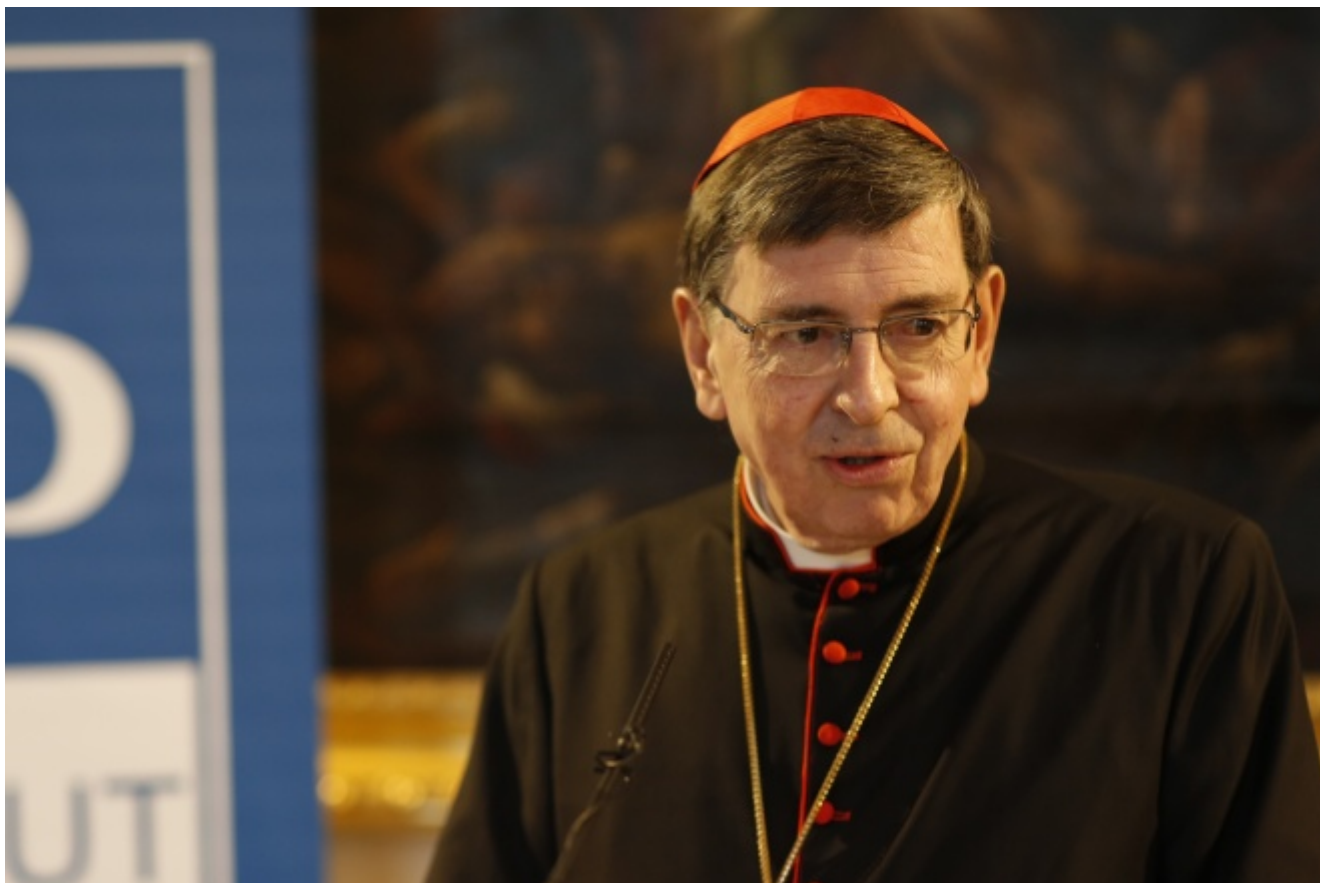
Kardinal Kurt Koch